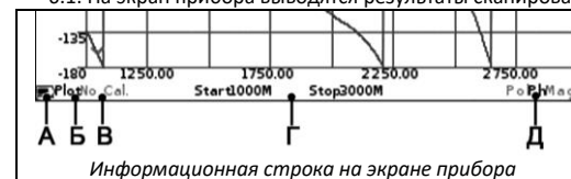
Информационная строка на экране прибора

6.1. На экран прибора выводятся результаты сканирования частотного задания в виде установленных пользователем графиков и диаграмм.